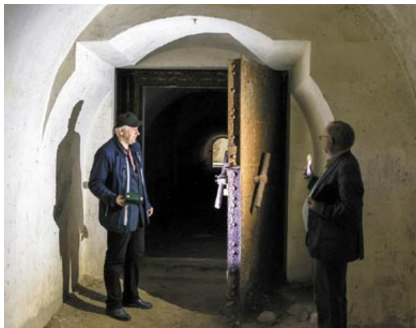
Бронированная дверь – молчаливый свидетель эпохи

огня перебегали по наведенному плоту через Буг. Одновременно заметил, что двух наших командиров убило на воротах форта... Я вскочил в казарму, подал тревогу. Выскочили из форта. Бежать к крепости не давал огонь противника, многих убило, ранило в районе форта».