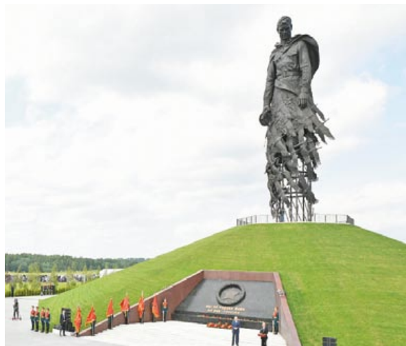
Мемориал советскому солдату около г. Ржева Тверской области