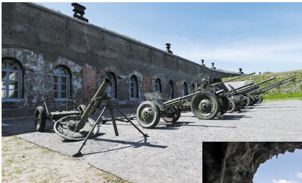
Музейную экспозицию «усиливает» выставка советского артиллерийского вооружения периода Великой Отечественной войны

огонь велся, когда неприятельские войска разворачивались для атаки в 3–4 километрах от форта. Это было прерогативой расположенных этажом ниже орудий меньшего калибра – не одного-двух, а целой батареи. При поддержке пушек в двух полукапонирах она могла вести эффективный залповый огонь вдоль водного канала. Если неприятелю все же удавалось пробиться сквозь огненный смерч, в дело вступали пехотинцы. Как и артиллеристы, они вели оружейный огонь из бойниц. Последняя «неприятность», поджидающая врага, – полоса из острых стальных шипов, установленных непосредственно перед огневыми точками: преодолеть их под градом пуль было просто нереально.