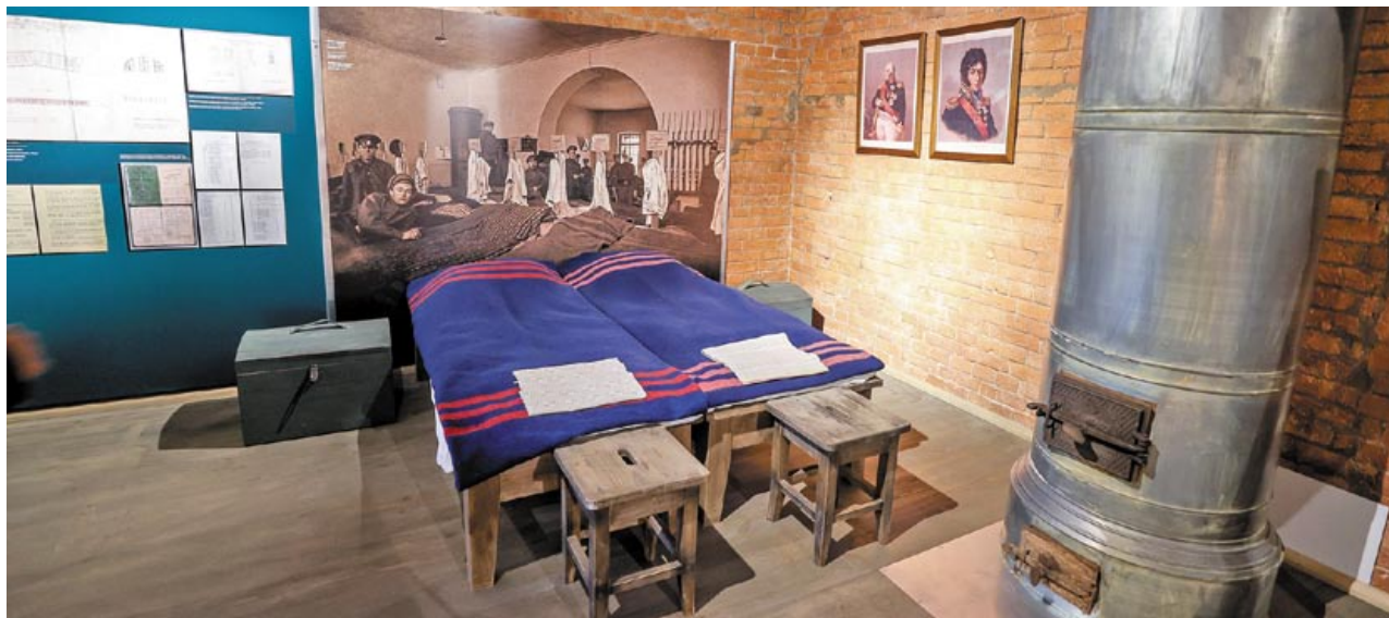
Порядок и чистота – главные атрибуты солдатского быта во все времена